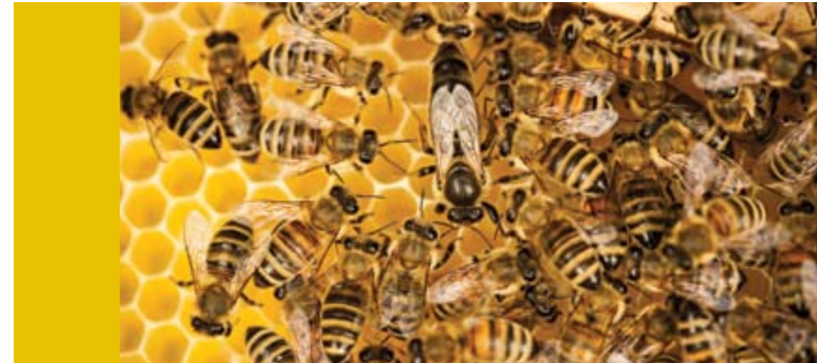
Méhek a méhanya körül a lépen