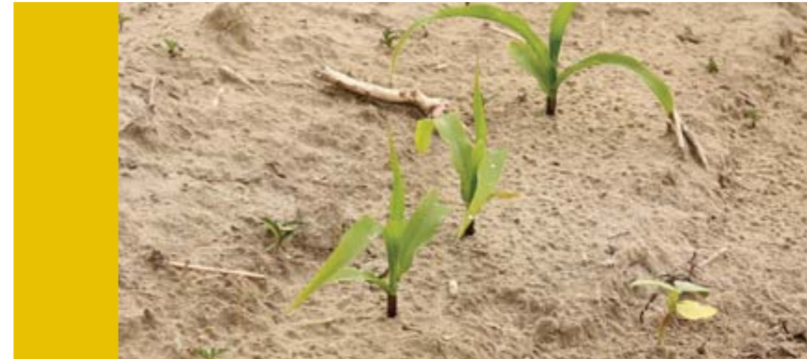
Sarjadó kukorica egy pest-megyei szántóföldön