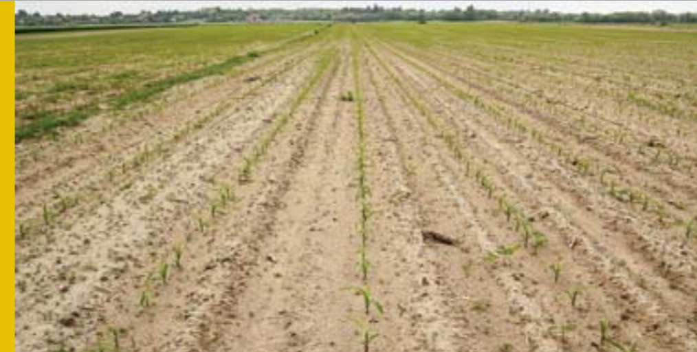
Kukoricatábla Pest-megyében

Annak érdekében, hogy a szisztémikus (felszívódó) növényvédő szerek méheket érő lehetséges veszélyeit kiértékelje, az Európai Élelmiszerbiztonsági Hatóság (EFSA) elemzést készített három neonikotinoid rovarirtóról, a tiametoxámról, az imidaklopridról és a klotianidinről. Ezek az elemzések támasztották alá az Európai Bizottság azon későbbi döntését, amely két évre megtiltotta a három szer bizonyos esetekben és módon történő felhasználását. Tudományos kutatások alapján kockázatokat azonosítottak, valamint felhívták a figyelmet a nagymértékű adathiányra, amelynek következtében nem volt lehetséges kimerítő és átfogó kockázatelemzést készíteni. Egy kulcsfontosságú, feltehetően kockázatot jelentő, de adathiányos terület, melyet az EFSA minden hatóanyag esetében azonosított, a guttációs folyadék szerepe. Guttációs folyadékot minden termesztett növény kibocsát magából. Amikor a méhek és más beporzó rovarok a guttációs folyadékot maguk vagy az egész méhcsalád számára vízforrásként használják, a fenti rovarölő vegyszerekkel potenciálisan találkozhatnak.